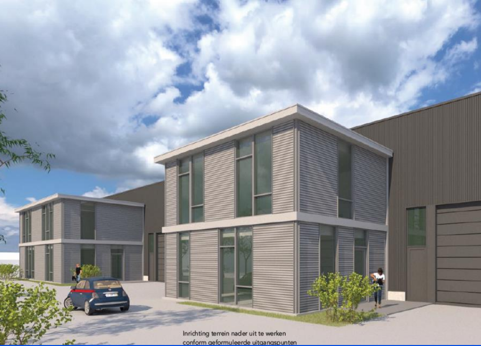
Inrichting terrein nader uit te werken conform geformuleerde uitgangspunten